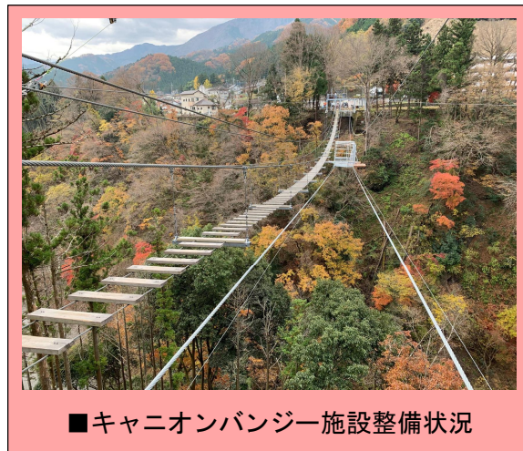
■キャニオンバンジー施設整備状況

この施設は、既存の吊り橋施設「キャニオンウォーク」に併設された飛び込み台（デッキ）から荒川渓谷にダイブするバンジージャンプ型施設で、ハーネス（安全帯）を着用して渡る吊り橋を介して行う同様の施設は国内初となります。