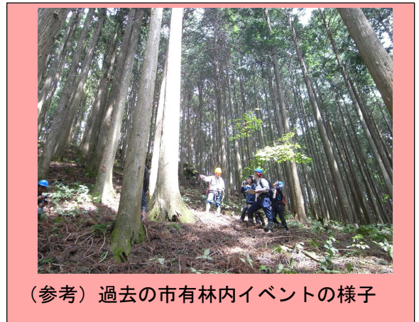
(参考) 過去の市有林内イベントの様子